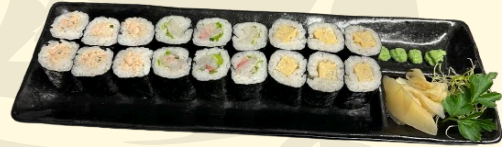
NIIGATA 12.00€ Assortiment de 18 pièces