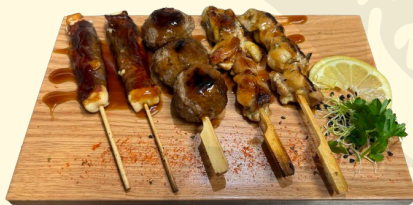
KUSHI YAKIS 12.00€ Assortiment de 5 brochettes