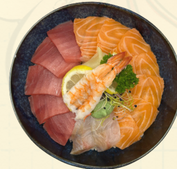
CHIRASHIS 14.00€ Un bol de riz vinaigré sur lequel sont déposées de fines tranches de poisson cru