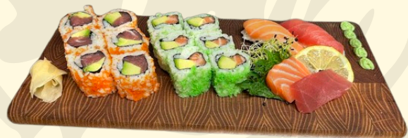
ISHIKARI 18.00€ Assortiment de 16 pièces