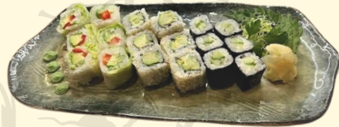
YASAI 14.50€ Assortiment de 18 pièces