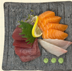
SASHIMIS 13.00€ 10 tranches de poisson cru