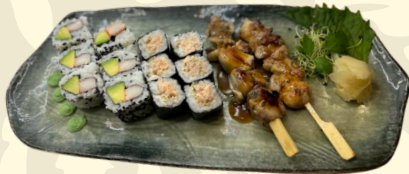
KURUME 15.00€ Assortiment de 14 pièces