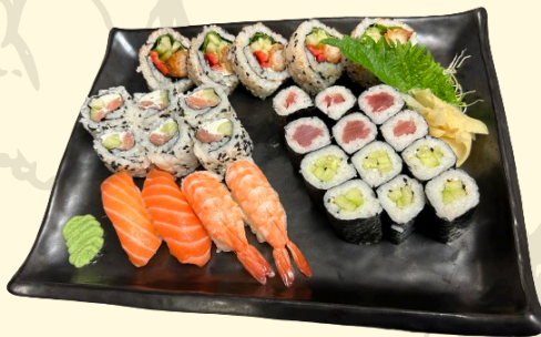
FUNAYA 28.00€ Assortiment de 27 pièces