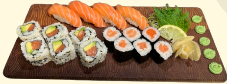
MISAKI 16.50€ Assortiment de 16 pièces