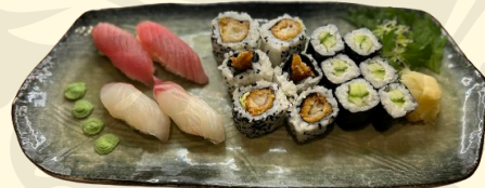
AWAJI 16.50€ Assortiment de 16 pièces