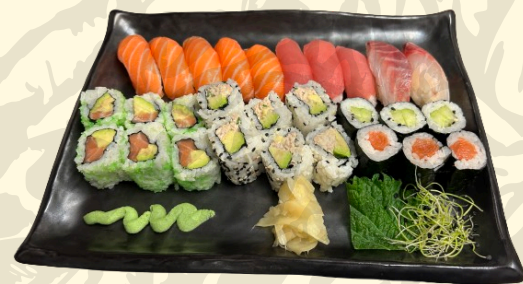
TAKAYAMA 34.00€ Assortiment de 28 pièces