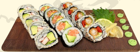
FUTOMAKI 18.00€ Assortiment de 15 pièces