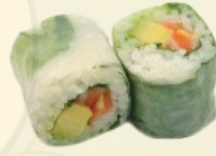
SPRING ROLLS 6.60 € 6 pièces