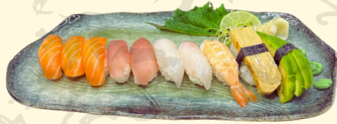
KAISEN 17.50€ Assortiment de 10 nigiris