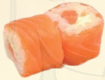
SALMON ROLLS 6.80 € 6 pièces