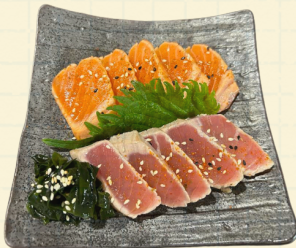
TATAKIS 14.00 € 10 tranches de poisson très brièvement saisies

Toshi (surimi, crevette, avocat et salade)