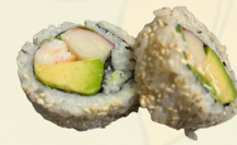
BIG ROLLS 6.50€ 5 pièces

Spicy eby rolls (torpedo, concombre, poivron, shichimi et salade)